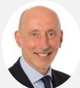
Jean-Raymond Hugonet Co-Rapporteur Sénateur de l'Essonne ( Les Républicains )