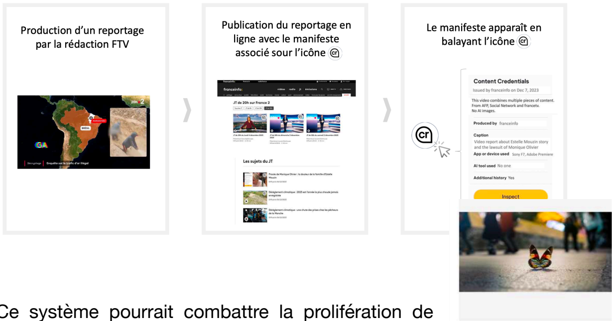
Illustration du C2PA / content credentials

Ce système pourrait combattre la prolifération de fake News dûe à des images créées par IA.